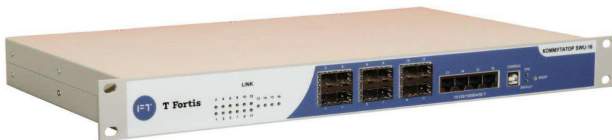
Рис. 2.1. Внешний вид