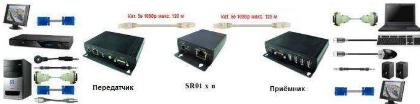
Рис. 5 Схема подключения SR01 совместно с VKM03.