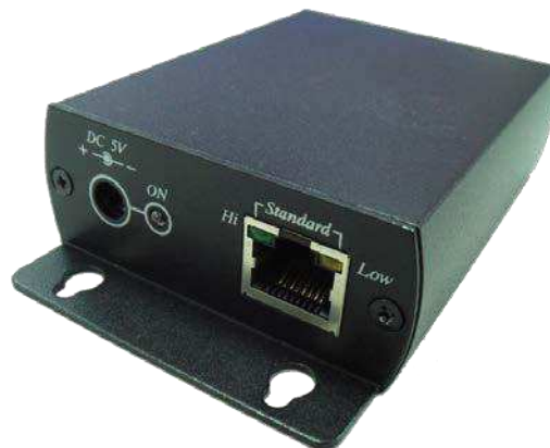
Рис. 1 Внешний вид устройства SR01