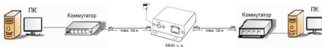
Рис. 6 Схема подключение SR01 к сети Ethernet