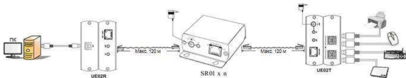
Рис. 4 Схема подключения SR01 совместно с UE02.