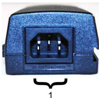
Рис.2 Инжектор Midspan-1/300GA, Midspan-1/300G, Midspan-1/600G вид сзади