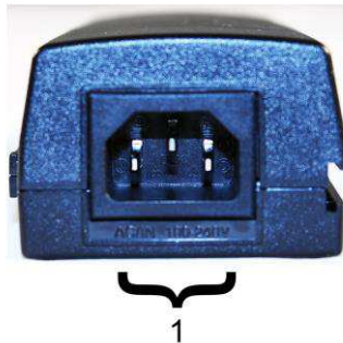
Рис. 2. Инжектор Midspan-1/190A, Midspan-1/300A Midspan-1/300G, вид сзади