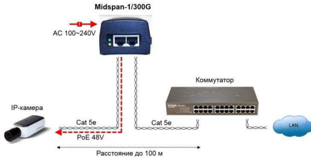
Рис. 3. Схема подключения инжектора Midspan-1/300G

Инжекторы Midspan-1/190A, Midspan-1/300A подключаются аналогично.