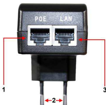
Рис. 1. Инжектор Midspan-1/151, Midspan-1/151A