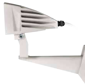
GEKO IRN 24VAC/12-24VDC