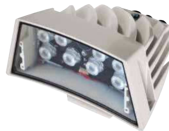
ПРОЖЕКТОР GEKO IRN 24VAC/12-24VDC (БЕЛЫЙ СВЕТ)

Гарантия на инфракрасный осветитель GEKO действует в течение 5 лет, в то время как для осветителя GEKO с белым светом - 2 года.