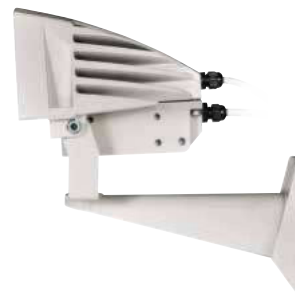
GEKO IRN 90-240 В ПЕРЕМЕННОГО ТОКА