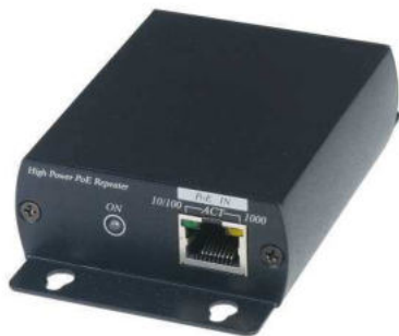
Рис. 1 IP04X Вид спереди