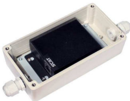
Рис.5 Внешний вид IP04X-SO