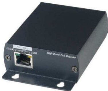
Рис. 2 IP04X Вид сзади