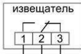
Рисунок 2б. Схема подключения ИО102-51(П)

(контакты 1 и 2 замыкаются под действием магнита)