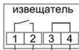
Рисунок 2в. Схема подключения ИО102-51(НР+Пр)

(контакт 2 под действием магнита размыкается с контактом 3 и замыкается с контактом 1. 1-красный, 2-черный 3-синий)