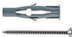
Дюбель типа F