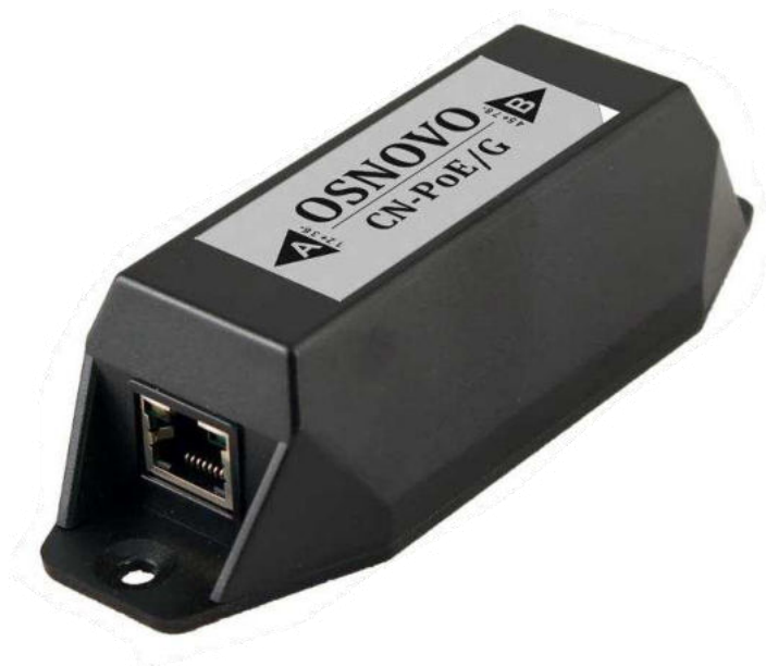
Рис.1 Конвертер методов PoE CN-PoE/G, внешний вид