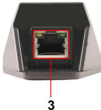
Рис. 3 Конвертер методов PoE CN-PoE/G, индикаторы