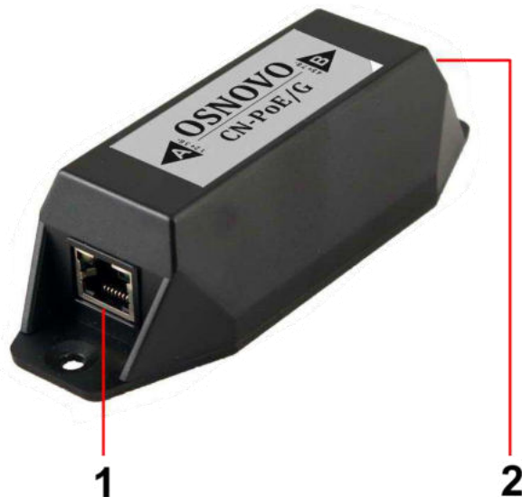
Рис. 2 Конвертер методов PoE CN-PoE/G, разъемы