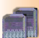
BlackDiamond 8800 e series