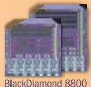
BlackDiamond 8800 e series