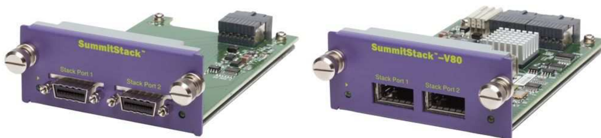
Модуль SummitStack и модуль SummitStack-V80 для Слота В

Пропускная способность Слота В составляет 40Гбит/сек, что позволяет обеспечивать шину стекирования SummitStack-V80 в 80Гбит/сек. Кроме этого, такая пропускная способность позволит получить 4 порта 10Гбит/сек на полной скорости – в том случае, если такой модуль для Слота В будет выпущен.