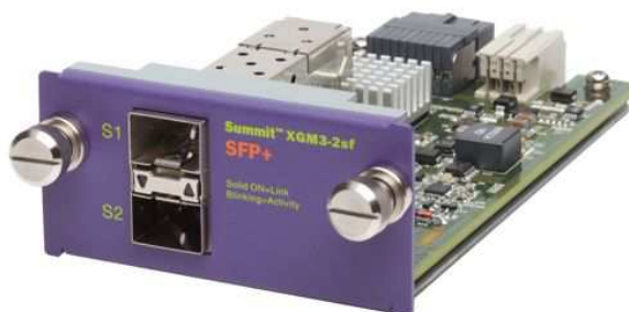
Модуль XGM3-2sf для Слота А

Слота А предназначен для установки опционального модуля с портами 10Гбит. В данный момент предлагается модуль с портами SFP+, но в дальнейшем также ожидается выпуск модулей с другими типами портов. Пропускная способность Слота А составляет 20Гбит/сек, что позволяет использовать 2 порта 10Гбит на полной скорости без переподписки.