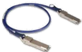
Кабели QSFP+ пассивный медный 1 метр

SummitStack-V80 обеспечивает в два раза больше пропускную способность по сравнению с SummitStack. Но основное преимущество SummitStack-V80 состоит в возможности стекирования на расстоянии до 100 метров и в использовании стандартизованных физических интерфейсов QSFP+ и кабелей. В данный момент предлагаются следующие варианты кабелей стекирования: