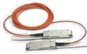
QSFP+ активный оптический 10 и 100 метров

SummitStack-V80 особенно востребован при соединении коммутаторов в ЦОДе между собой. В этом случае можно объединять коммутаторы X460, использующиеся в качестве Top of Rack коммутаторов, в один большой виртуальный модульный коммутатор. При этом каждый из X460 может иметь до 2 каналов 10Гбит для связи с ядром – или до 16 на стек.