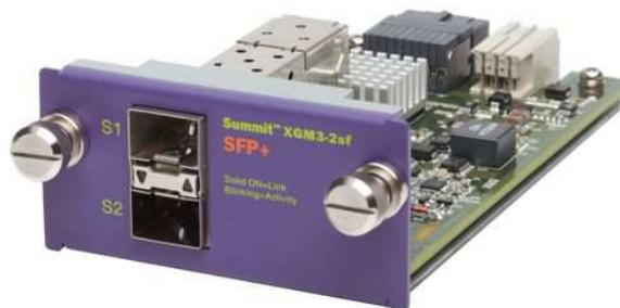
Модуль XGM3-2sf для Слота А

Слота А предназначен для установки опционального модуля с портами 10Гбит. В данный момент предлагается модуль с портами SFP+, но в дальнейшем также ожидается выпуск модулей с другими типами портов. Пропускная способность Слота А составляет 20Гбит/сек, что позволяет использовать 2 порта 10Гбит на полной скорости без переподписки.